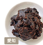
株式会社 まるや八丁味噌 三河産大豆の八丁味噌

外見からは想像できない程の 甘さを醸し出す、旨みと上品さを 兼ね備えた味噌です。