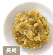
チョーコー醤油株式会社 九州麦みそ

三河産の大豆を100%使用。大 豆のみで麴を作り、2年以上の間 天然醸造しています。