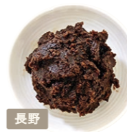
有限会社 井上醸造 けやきみそ

信州産大豆・米を100%使用。 3年間熟成させた独特のクセ、 コクと旨味が特徴の赤味噌。