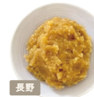
マルコメ株式会社 糀美人 二十四割糀

国産米100%の米糀を贅沢に使 用。やさしい甘みと、深い旨みが 特徴の無添加みそです。