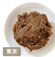
株式会社 日出味噌醸造元 江戸甘味噌

外見からは想像できない程の 甘さを醸し出す、旨みと上品さを 兼ね備えた味噌です。