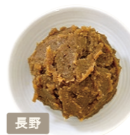
株式会社 三原屋 本蔵づくり こし

国産の大豆と米の糀をたっぷり 使用し念入りに仕込んだ、香り 豊かな甘口の信州味噌。