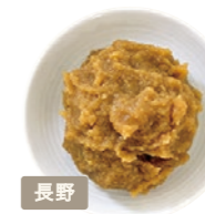
有限会社 酢屋亀本店 こがねこし

信州産大豆・米を100%使用。 3年間熟成させた独特のクセ、 コクと旨味が特徴の赤味噌。