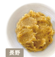
神州一味味噌株式会社 丸高蔵 十四割

発芽玄米の糀を使用した、やや 赤めのみそ。昔ながらの「天然醸 造」で約一年熟成させています。