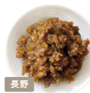
有限会社 穀平味噌醸造場 発芽玄米味噌 信大クリスタル水仕込み

国産米100%の米糀を贅沢に使 用。やさしい甘みと、深い旨みが 特徴の無添加みそです。