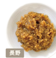
株式会社 よしのや 御開帳 粒黄

善光寺宿坊など、地元で愛され 続ける赤づくりの定番みそ。蔵元 で丹精込めて熟成させています。